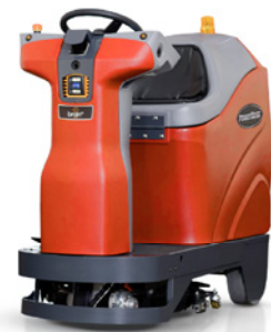
Kompakt und leistungstark für beste Reinigungsergebnisse

Von gangreichen Hallen und Lagern bis hin zu Einkaufszentren: Die autonome Reinigungsmaschine RoboScrub 20 ist bereit zum Einsatz. Sie ist intuitiv bedienbar und navigiert sicher auch in komplexen Umgebungen. Hindernisse werden von den Kamerasystemen erkannt und von der BrainOS®-Technologie in Befehle umgewandelt – wie Umfahren oder Maschinenstopp. Für kurze Reinigungseinsätze zwischendurch lässt sich der RoboScrub 20 auch als herkömmliche Ride-on-Scheuersaugmaschine nutzen.