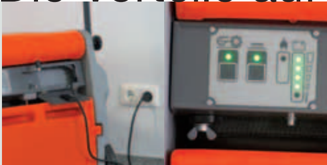
On-Board-Ladegerät zum Laden an jeder verfügbaren Steckdose. Einfachste Bedienung und klare Information.