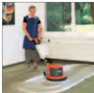
Hako-Super 43/2-speed Universelle Einscheibenmaschine für den Schrubb- und Poliereinsatz durch 2 einstellbare Drehzahlen. Typischer Einsatz: Schrubben und Polieren mit einer Maschine.