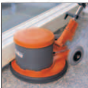
Der flache, auskragende Bürstenkopf ermöglicht das Arbeiten auch unter Heizkörpern etc.