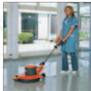
Hako-Super 53/1100 High-Speed-Maschine zum Polieren, Cleanern und Spraysen. Höhere Produktivität durch Powerflow. Typischer Einsatz: Polieren von modernen Hartbodenbelägen.