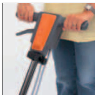
Ergonomisch: Stufenlose Deichsel- bzw. Stielverstellung gewährleistet eine perfekte Höhen-Einstellung.