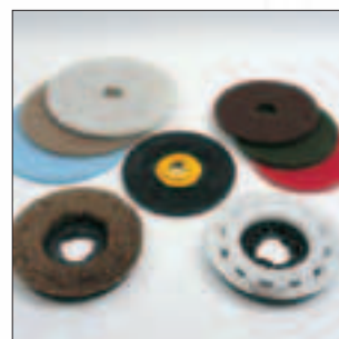
Umfangreich: Die große Auswahl an Bürsten, Pads und Treibteller deckt alle Einsatzmöglichkeiten ab.