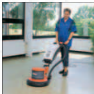
Hako-Super 43/450 High-Speed-Maschine zum Hochglanzpolieren und Cleanern. Bauweise wie Hako-Super 43/180. Typischer Einsatz: Polieren von weichen Beschichtungen.