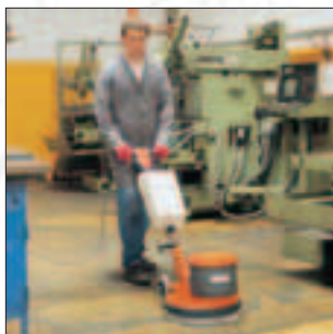
Hako-Super 43/180 Die Standardmaschine für die Grund- und Unterhaltsreinigung. Typischer Einsatz: Teppichschampooierung und die Grundreinigung aller Hartbodenbeläge.