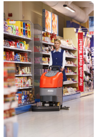
Hakomatic B 45 mit 65cm Tellerbürsten-Aggregat

In allen Bereichen mit rauen oder strukturierten Bodenbelägen wie in Logistik- und Industriehallen, Küchen oder Schwimmbädern findet die neue Hakomatic B 45 mit Walzenbürstentechnik ihr Einsatzgebiet. Das Schrubbaggregat mit einer Arbeitsbreite von 50 cm scheuert die Böden nicht nur besonders intensiv, sondern bietet gleichzeitig auch eine integrierte Kehrfunction. Das Kehrgut wird hierbei in einem eigenen Schmutzbehälter aufgefangen, der sich ohne Werkzeug entleeren lässt.