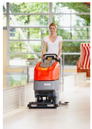
Hakomatic B 45 mit neuem Walzenbürsten-Aggregat